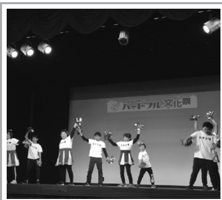
「みんなで舞台上に立とうを広げる会」は練習の成果を目いっぱい発表。