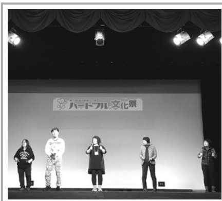
「ミュージック・ケア楽しみ隊」は親子のほのぼのの感に感動。