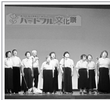
「コールわいわい」の透明感のある歌声に癒される。