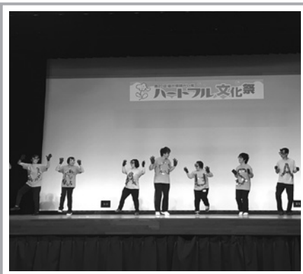
「つみきハウス」のU・S・Aダンスよく揃っていてカッコイイ。