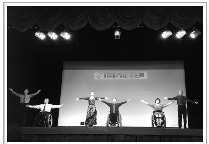
「ふくい車いすダンススポーツクラブ」のキレキレのダンスに感動。