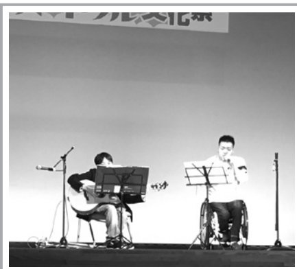
「まさよし」の歌声は安心感を助長。