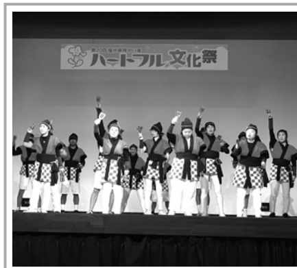
「のびのびカルチャー講座」英語の合唱とよさこいダンスの華やかさにくぎづけ。