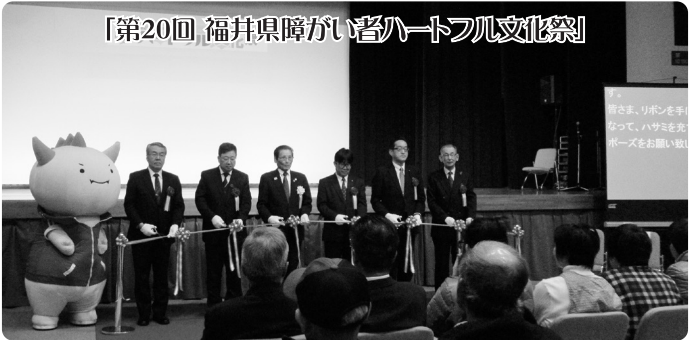
ご来賓の方々のテープカットで幕開けしました。

「第20回福井県障がい者ハートフル文化祭」が12月7日(土)～8日(日)の2日間、ショッピングシティ・ベル「あじさいホール」にて開催されました。