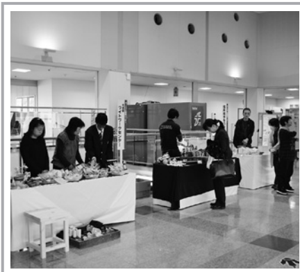
ケーキ・焼菓子や陶芸品などを並べ販売準備整いました。