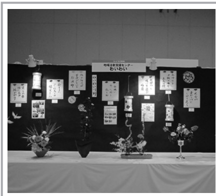
見ごたえのある作品や心温まる作品が華やかに彩りました。