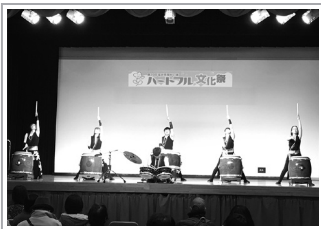
スペシャルステージの「葵太鼓 凜生～RIO～」の躍動感ある太鼓音が響く。

そして、即売コーナーでは、障害者就労支援施設や特別支援学校などで作ったケーキ・焼菓子や陶芸品などを買い求める人で賑わい、今年も温かなハートの輪が大きく広がった文化祭となりました!!。